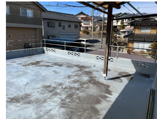
ルーフバルコニー