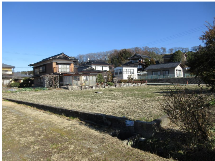
居宅・畑・田・倉庫