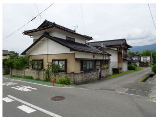
住宅・蔵・併用住宅